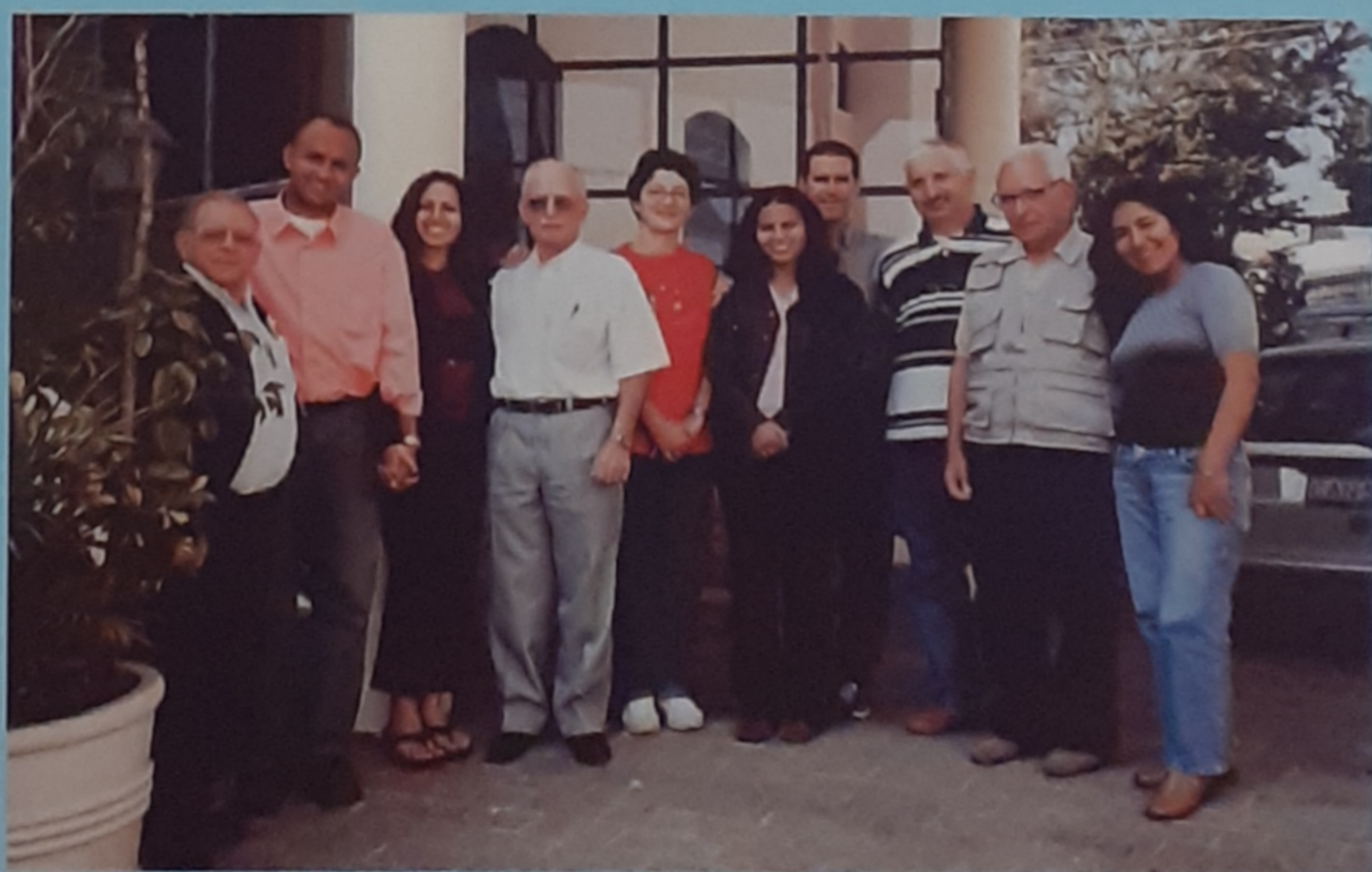
2003 - Sao Paulo (Brasile) - Gruppo iniziale