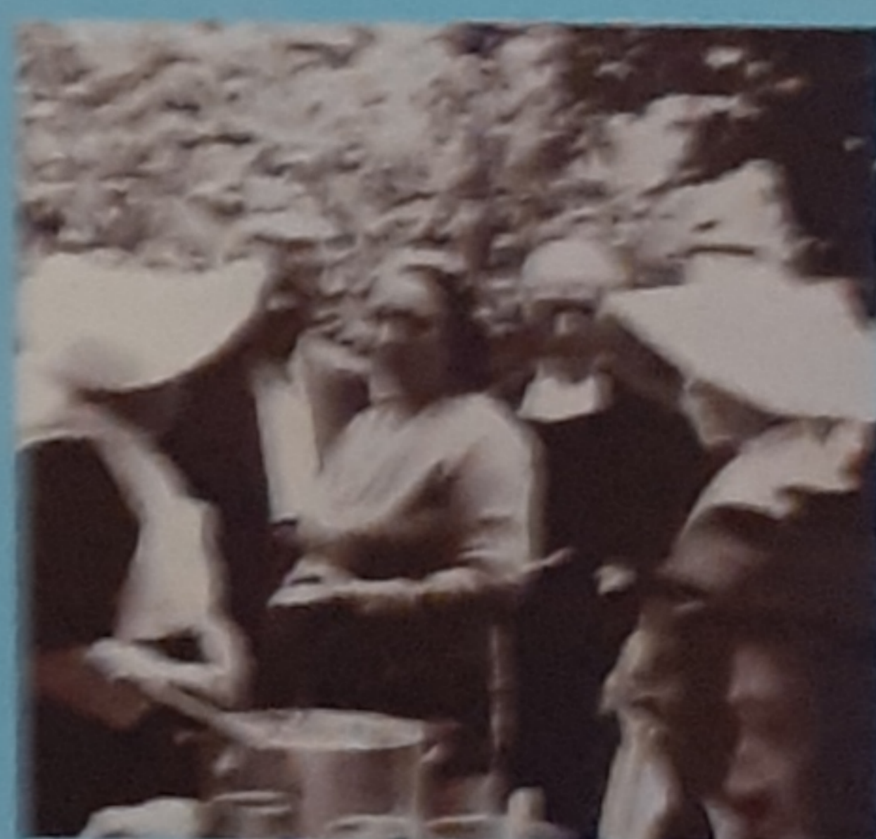
1945 - Messa del Povero