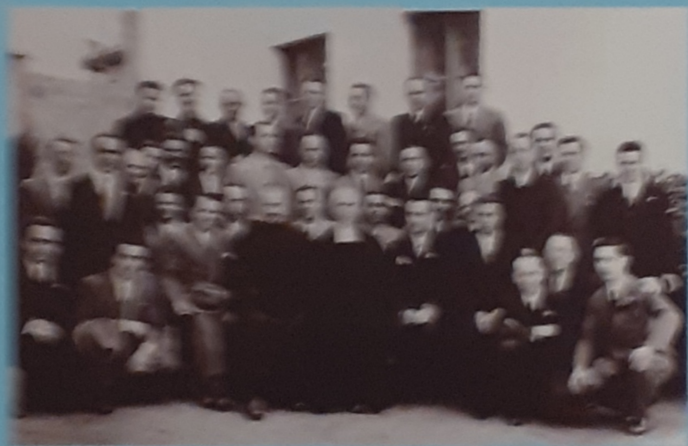
1944 - Gruppo insegnanti Casa di Carità - Via Foletto 8 - Torino