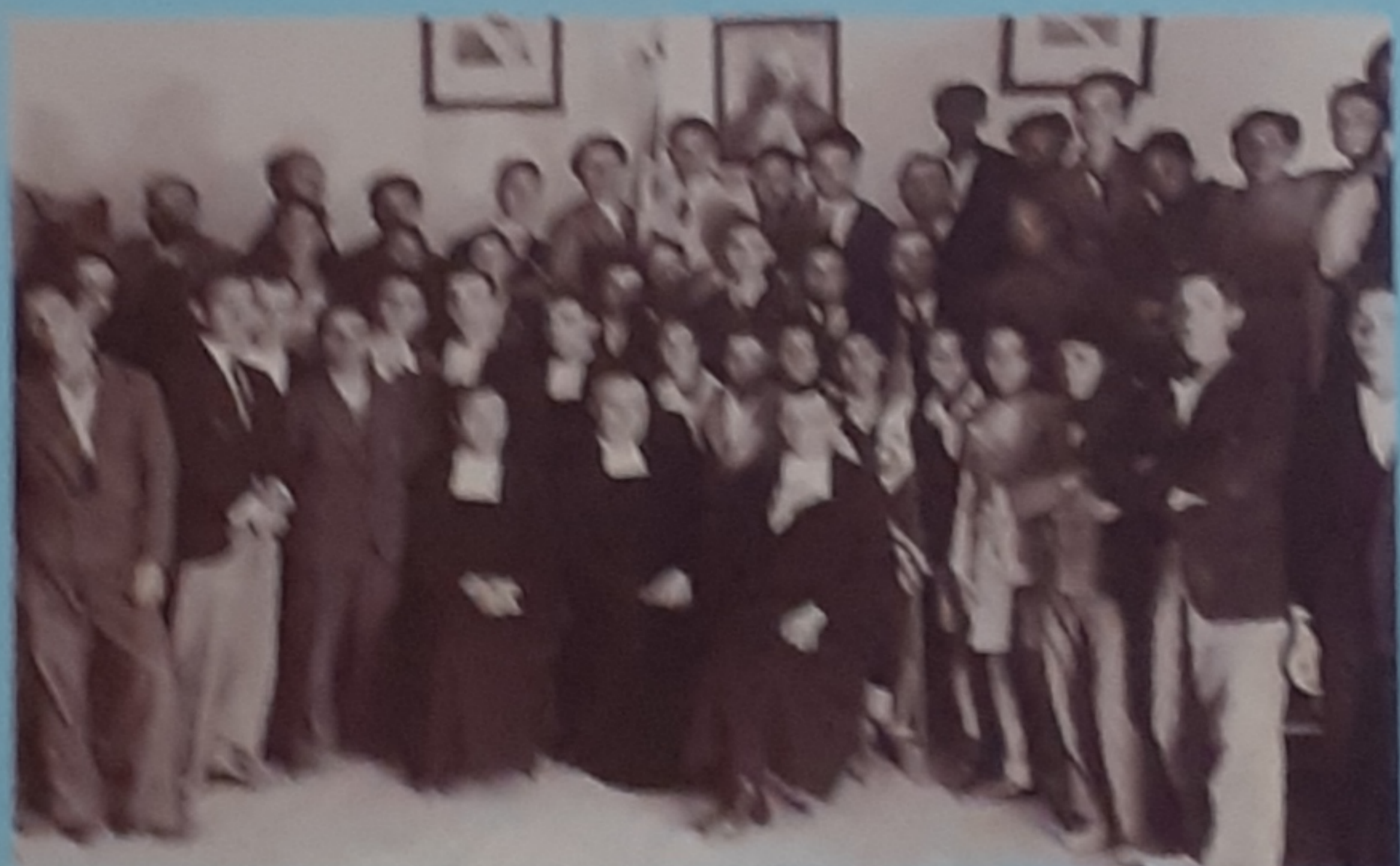
1950 - Sede di Borgone (A.O.)