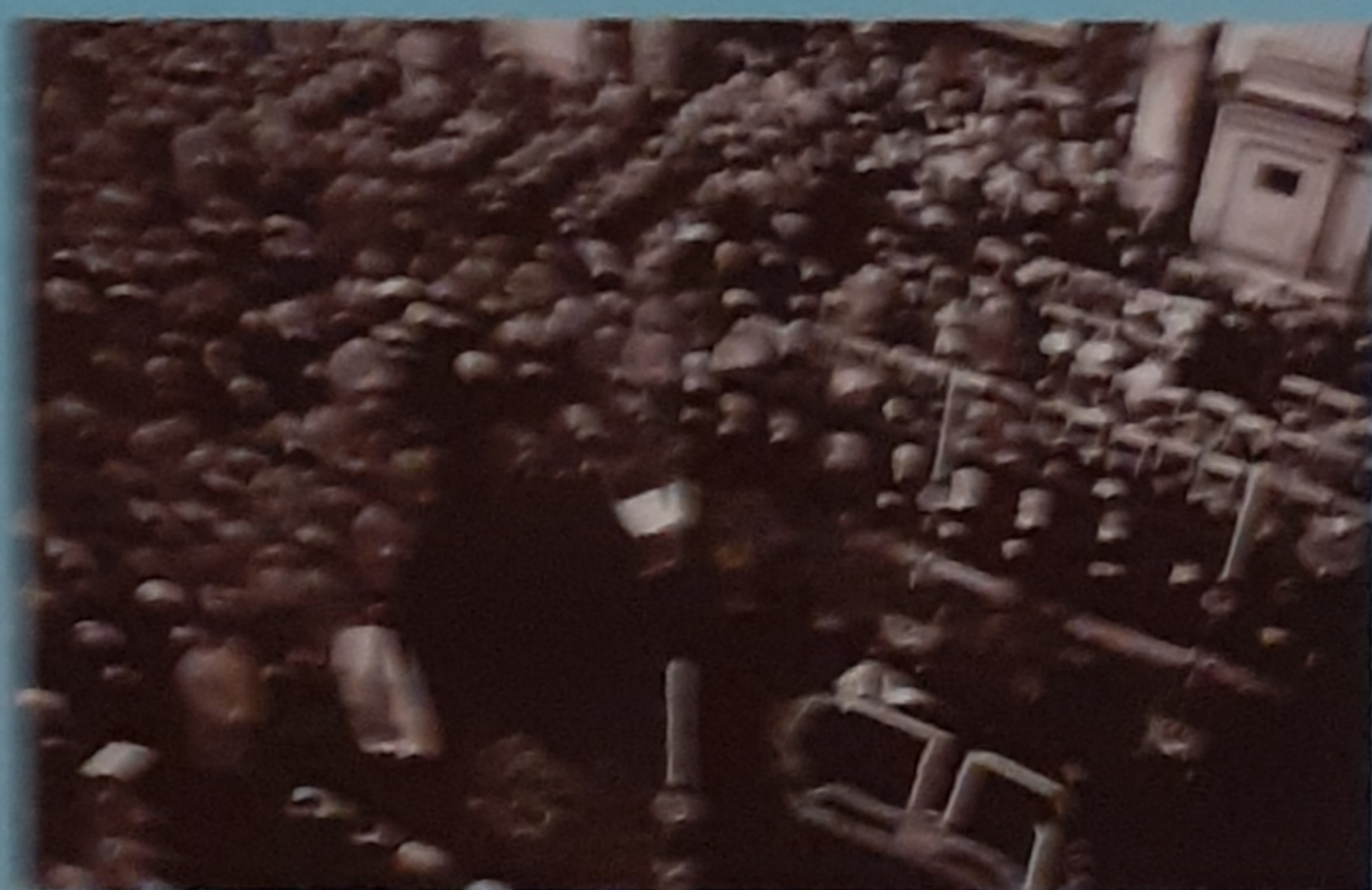
1959 - (Stessa) - Oggi - Torino - Organizzazione della Gioia