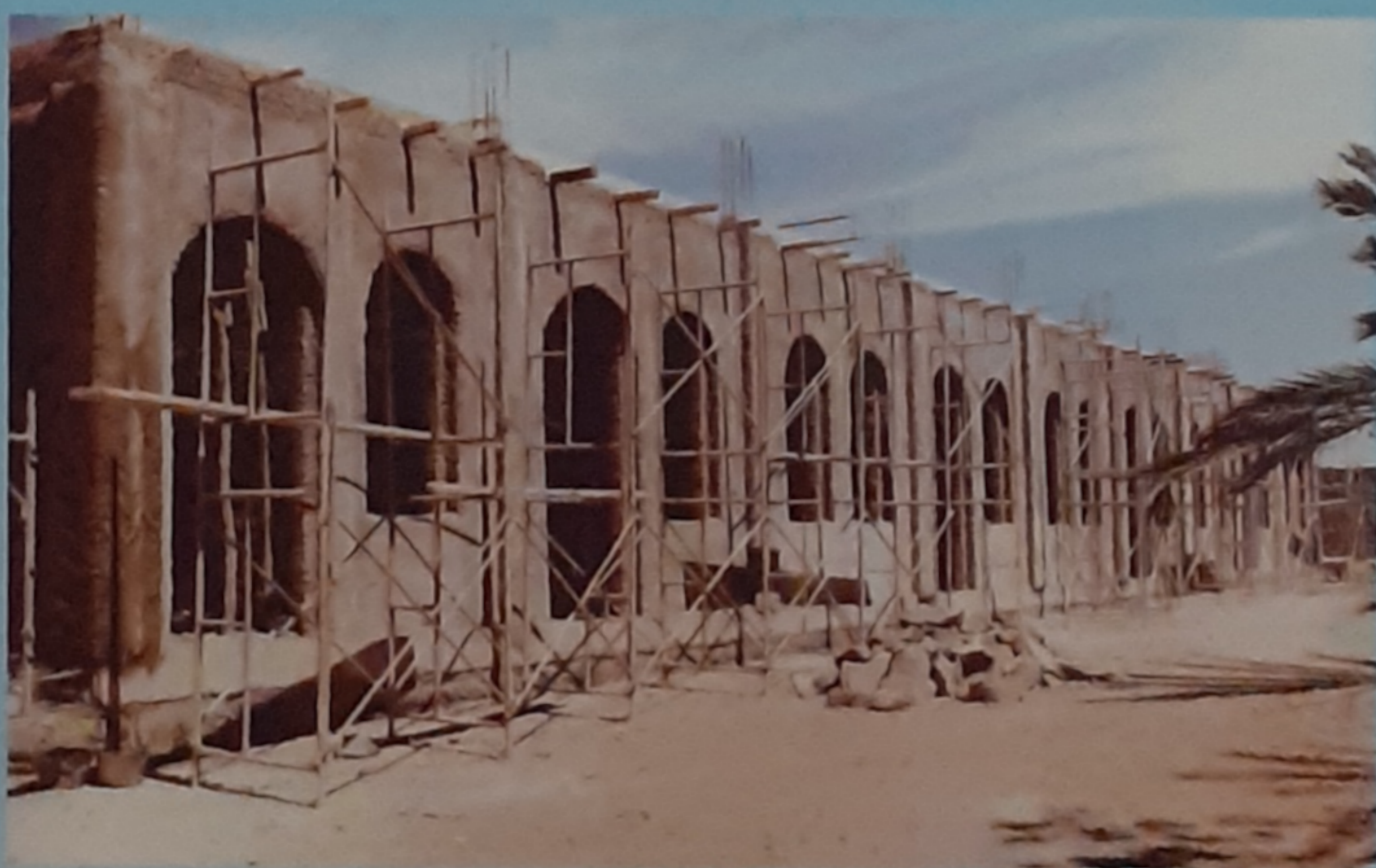
2004 Asmara (Eritrea) - Progetto "Charity Center"