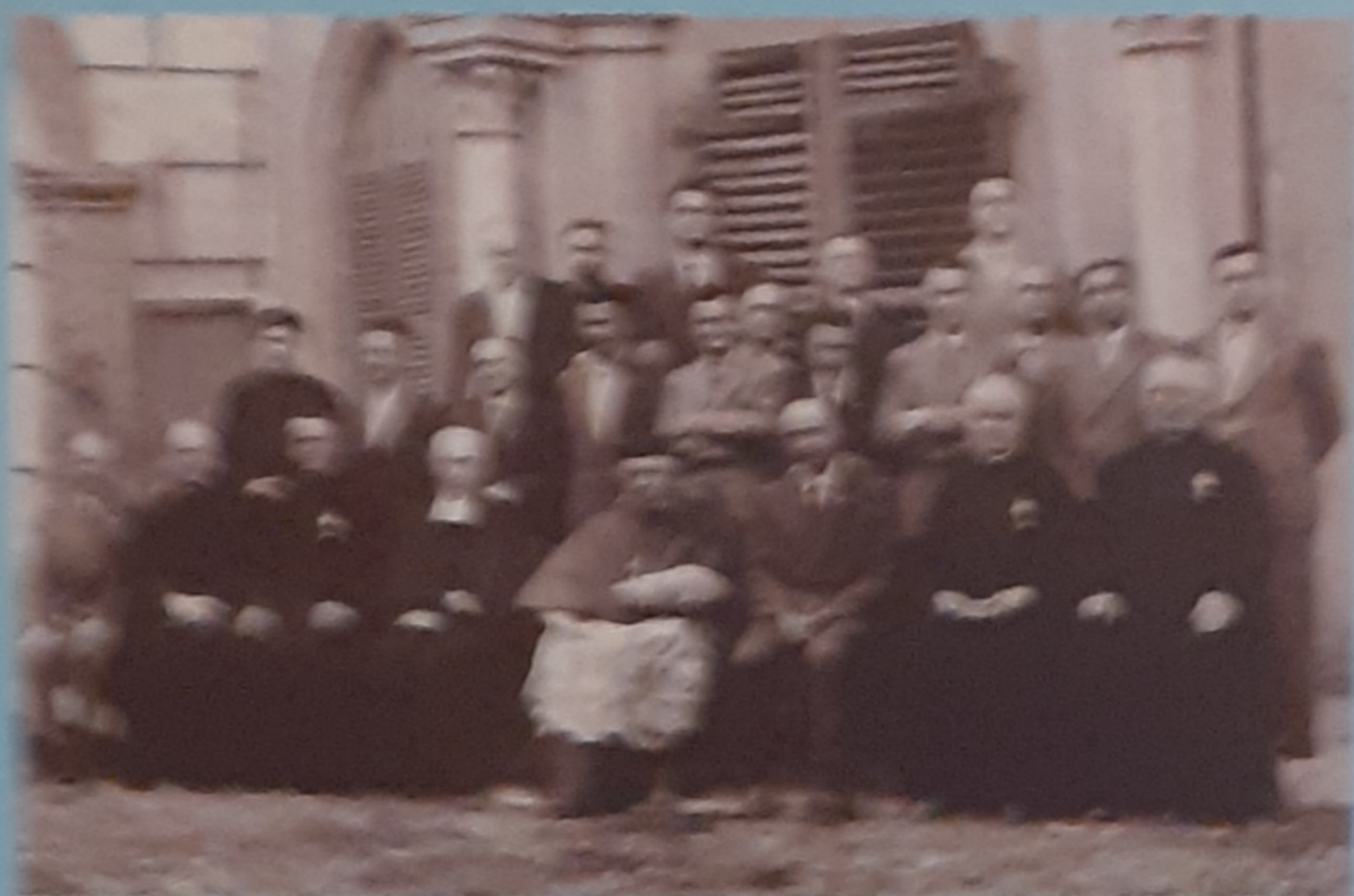
24 giugno 1944 - L'Arcivescovo di Torino, Card. Maurizio Fossati, approva l'Istituto Secolare.