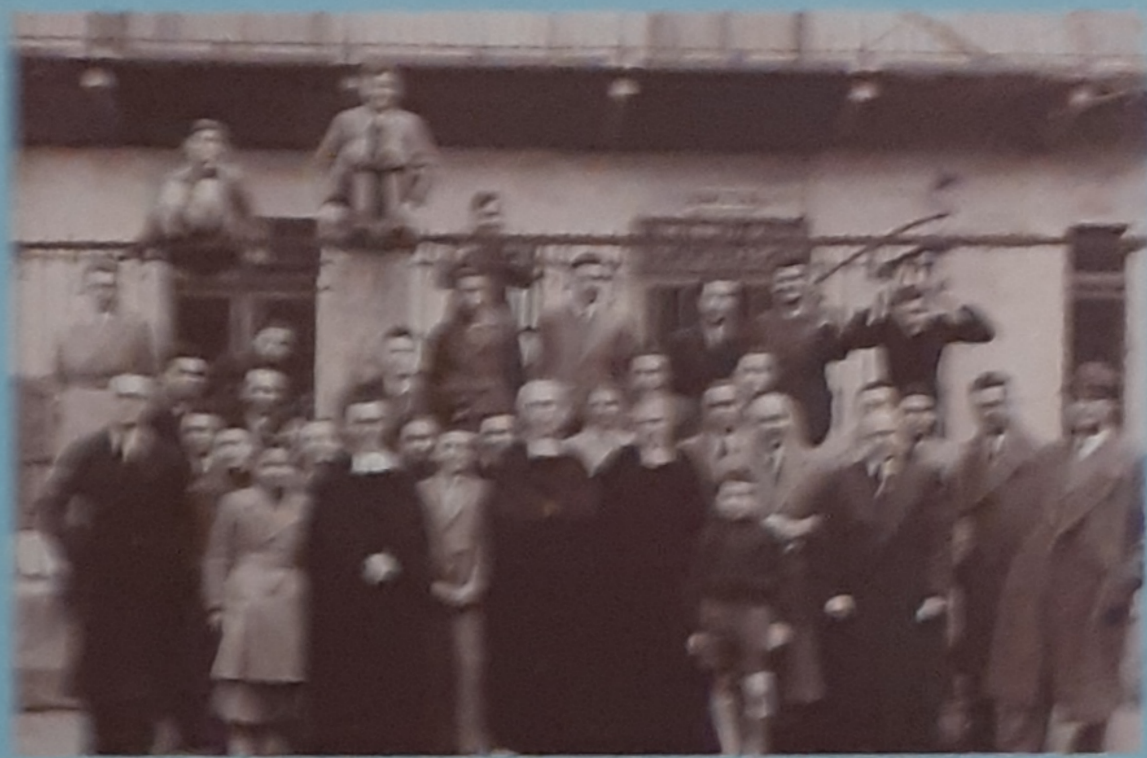
1944 - Con i Catechisti presso la Casa di Carità - Via Foletto 8 - Torino