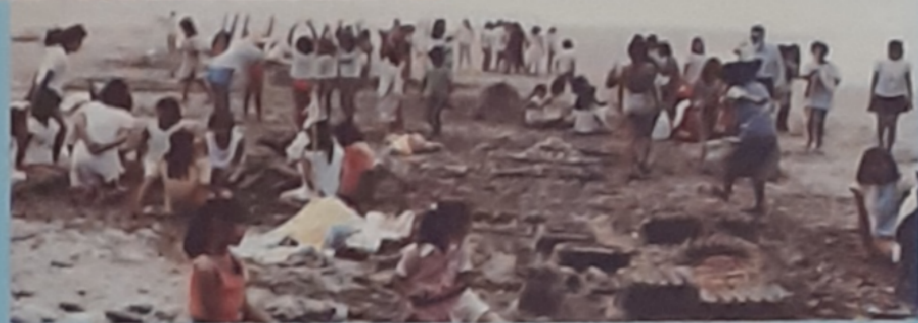
Arequipa-Camanà - Colonia Climatica Pio XII° - Obra Social