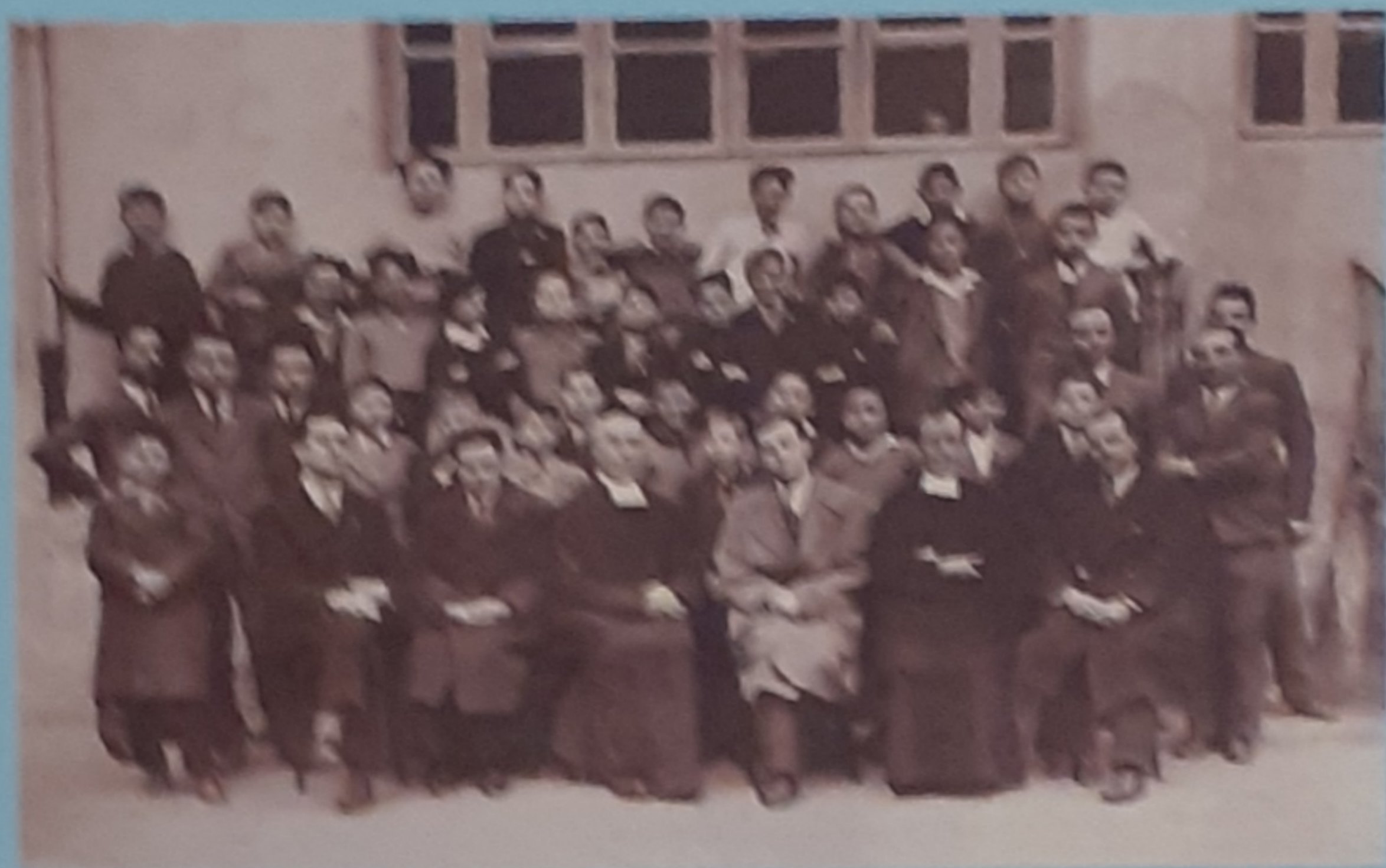
1950 - La Sede Unione Catechisti - Via dello Rostrino 14 - Torino