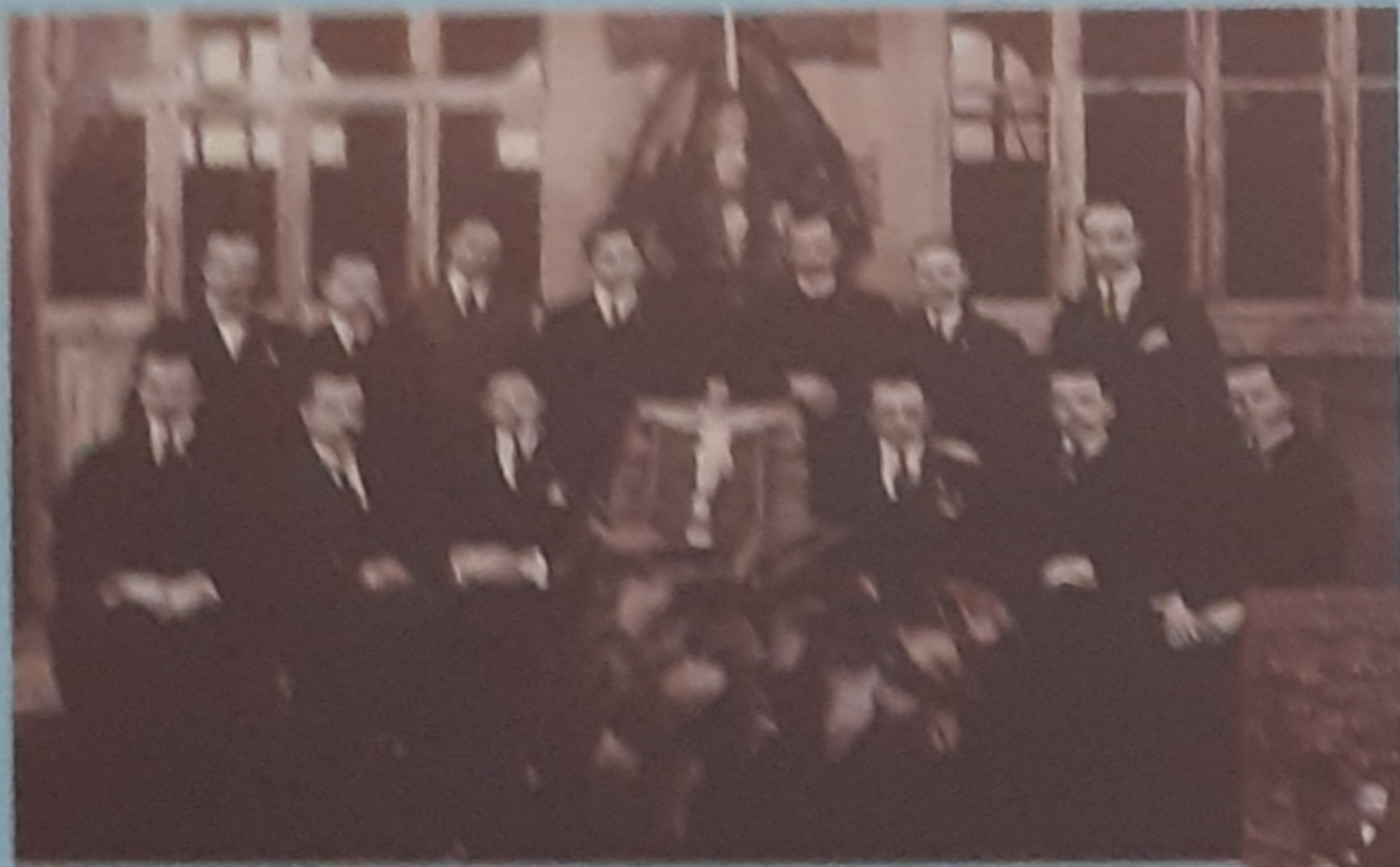
1918 - Fondazione dell'Unione Catechisti