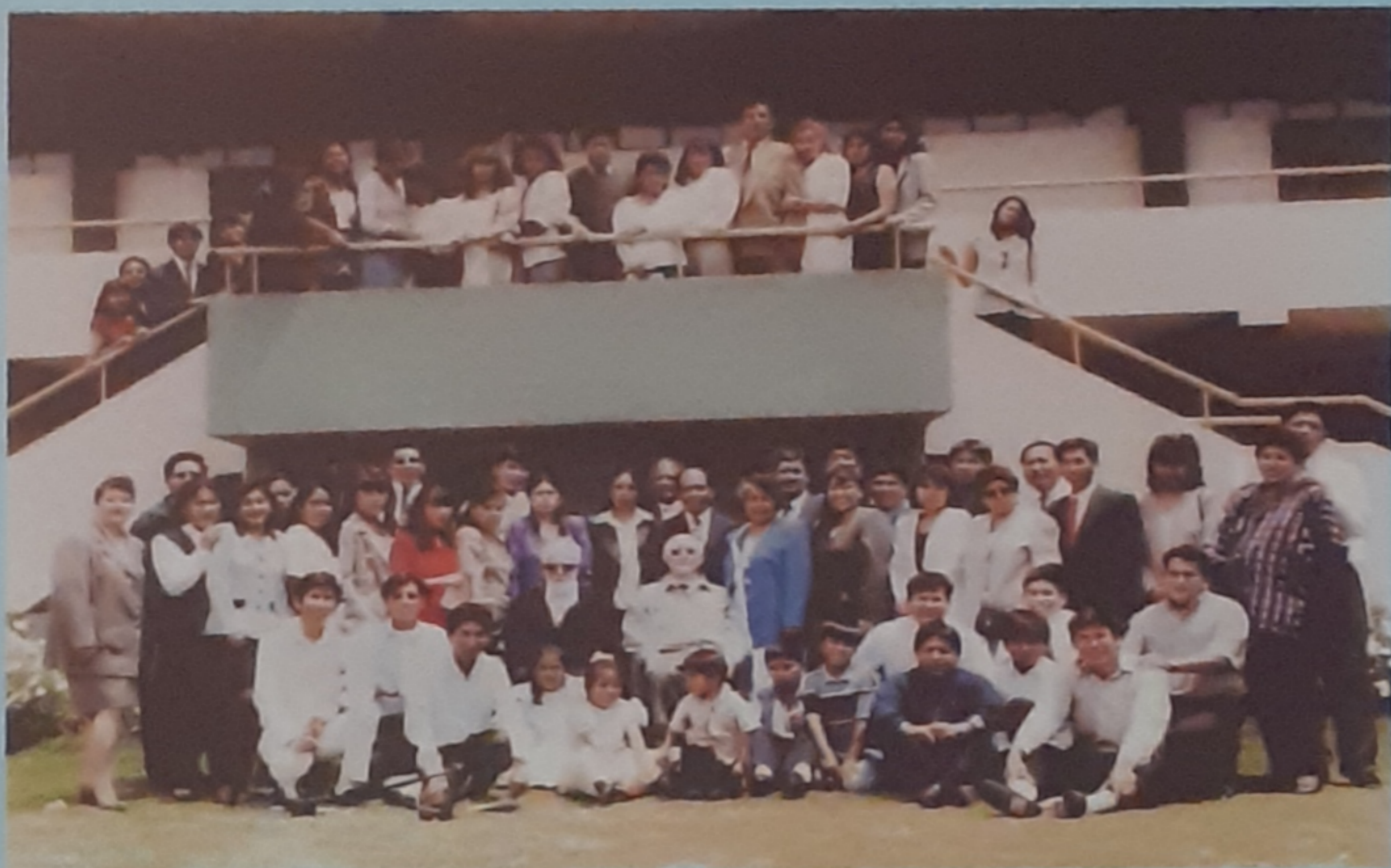
2000 - Arequipa (Perù) - Fraternità dell'Unione Catechisti