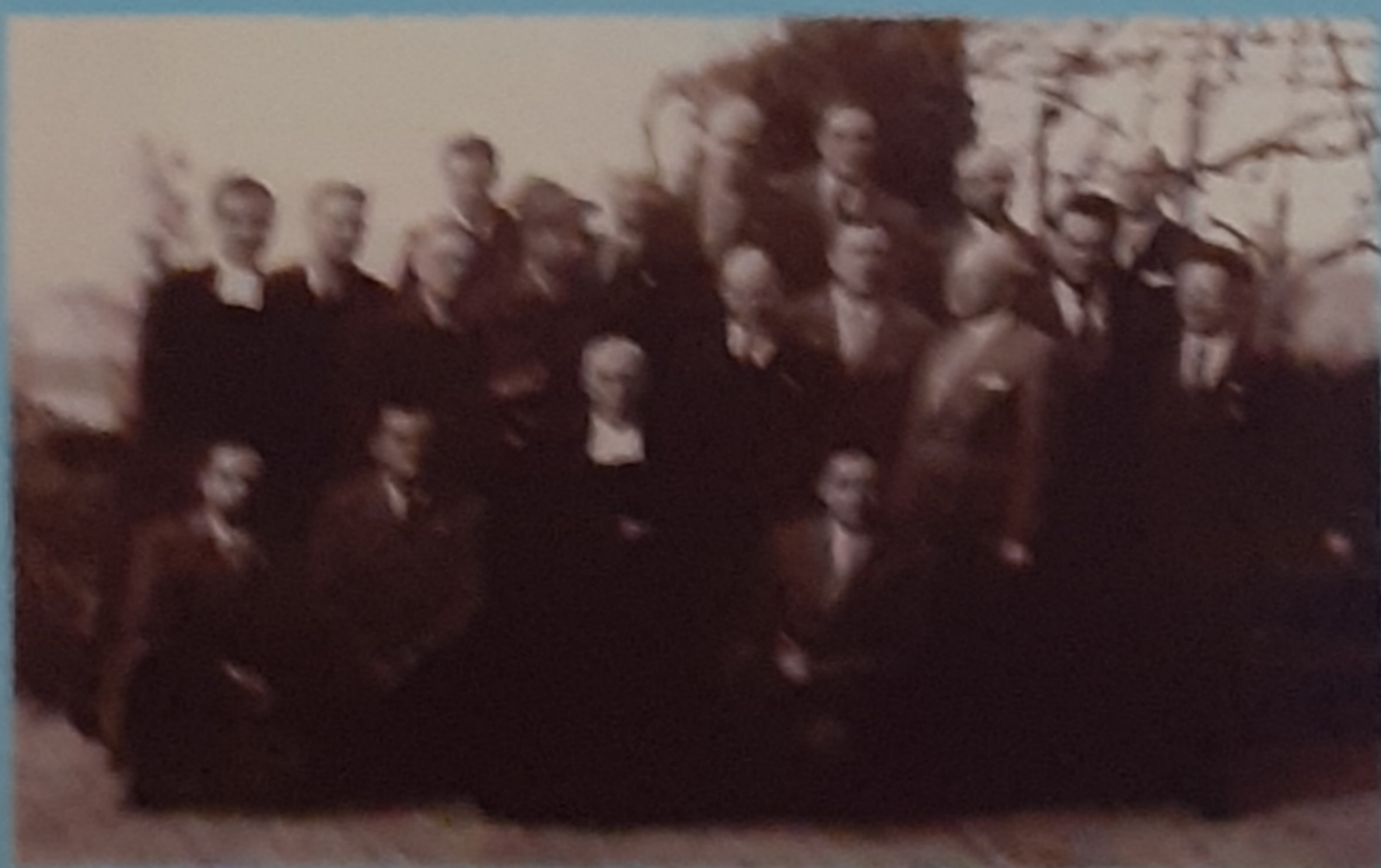
1950 - Sede di Borgone - Via S. Giuseppe Torino