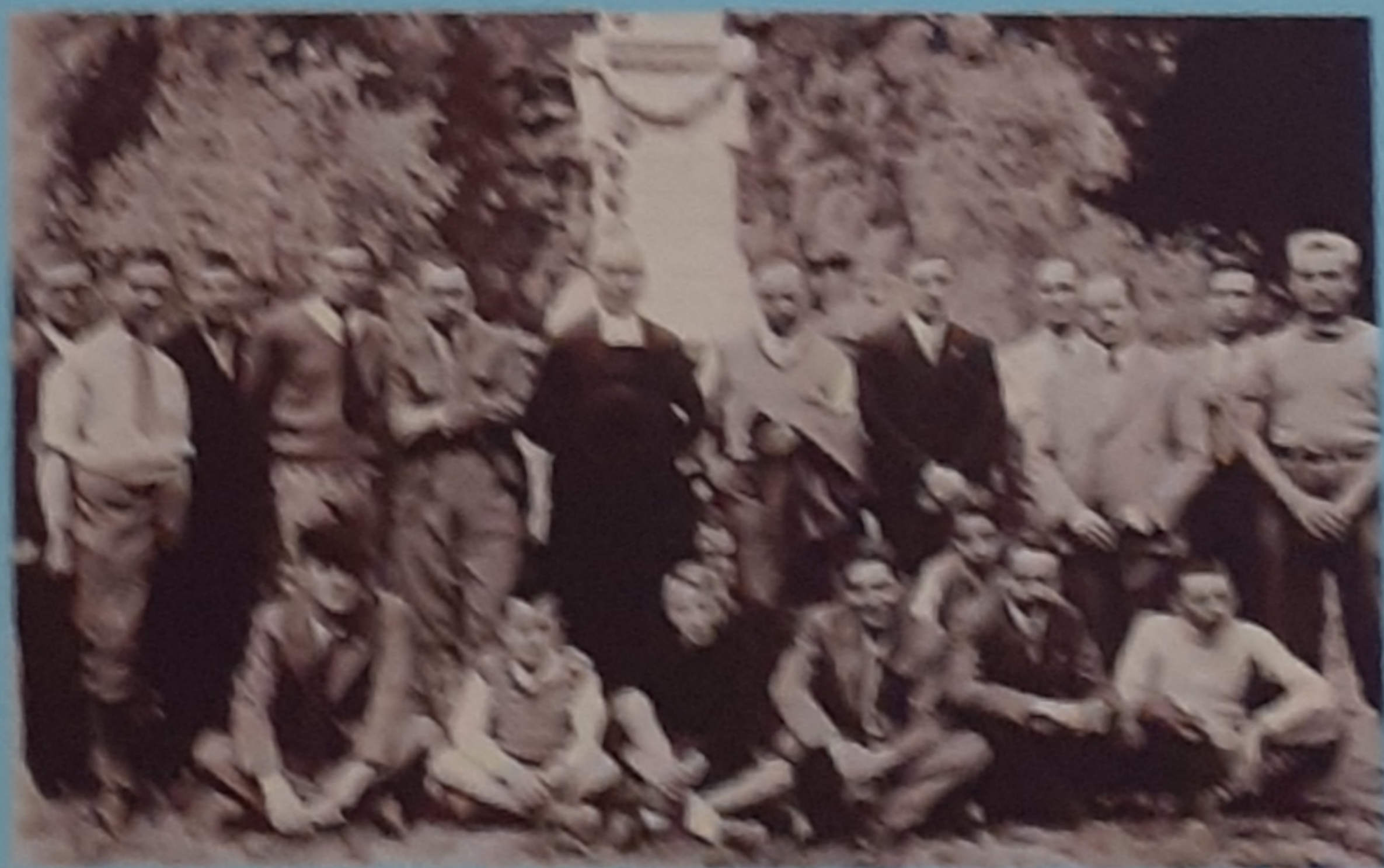
1950 - Gruppo outdoor - Valgrate Brianza