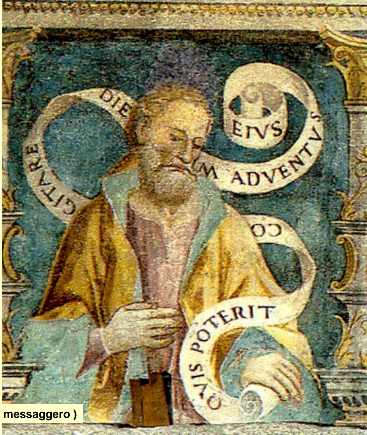
Malachia ( mio messaggero )