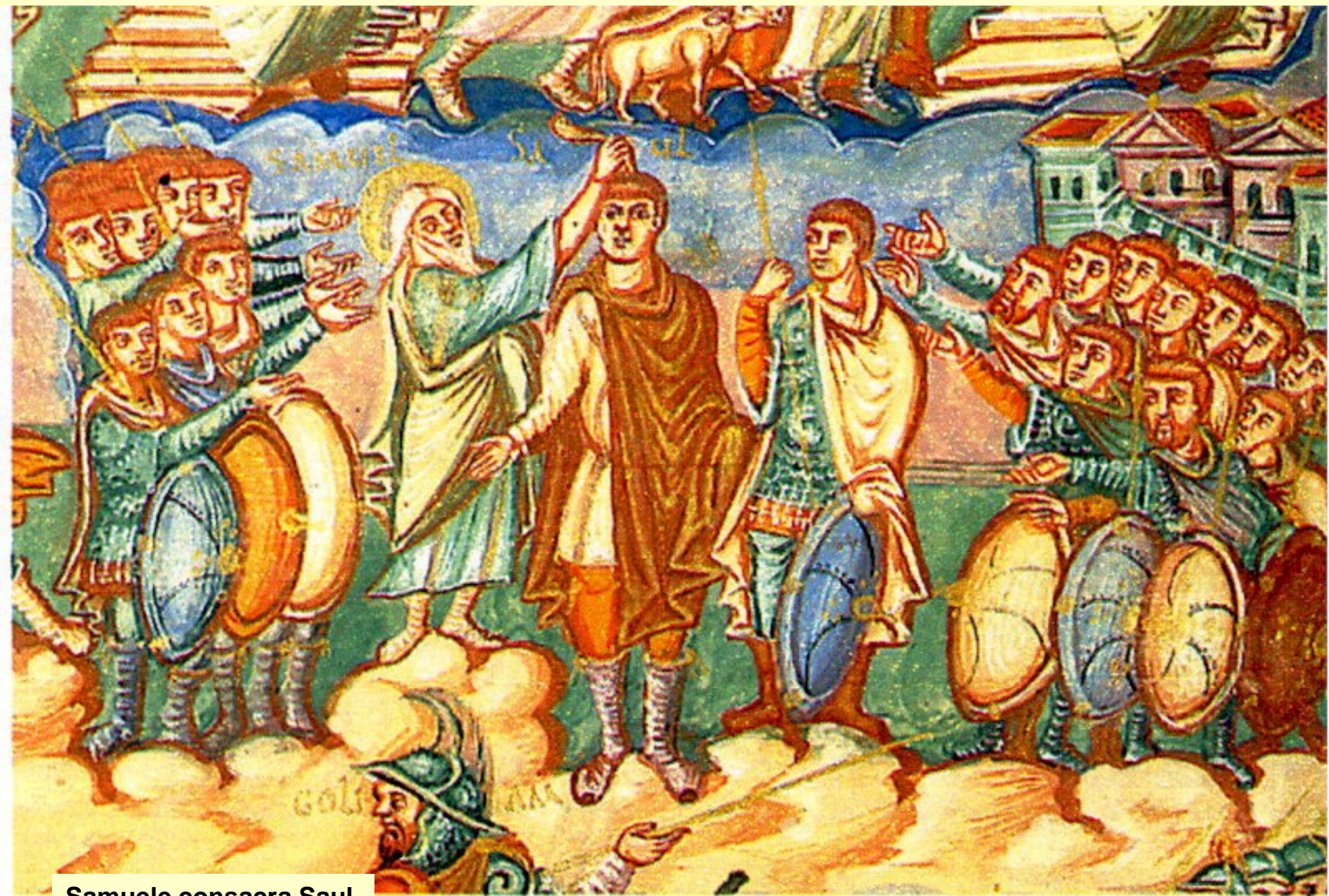
Samuele consacra Saul