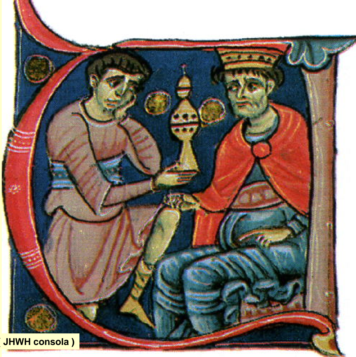
Neemia ( JHWH consola )