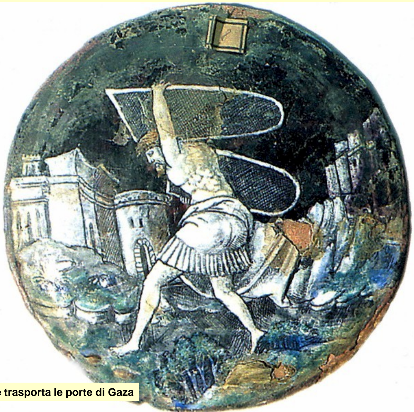
Sansone trasporta le porte di Gaza