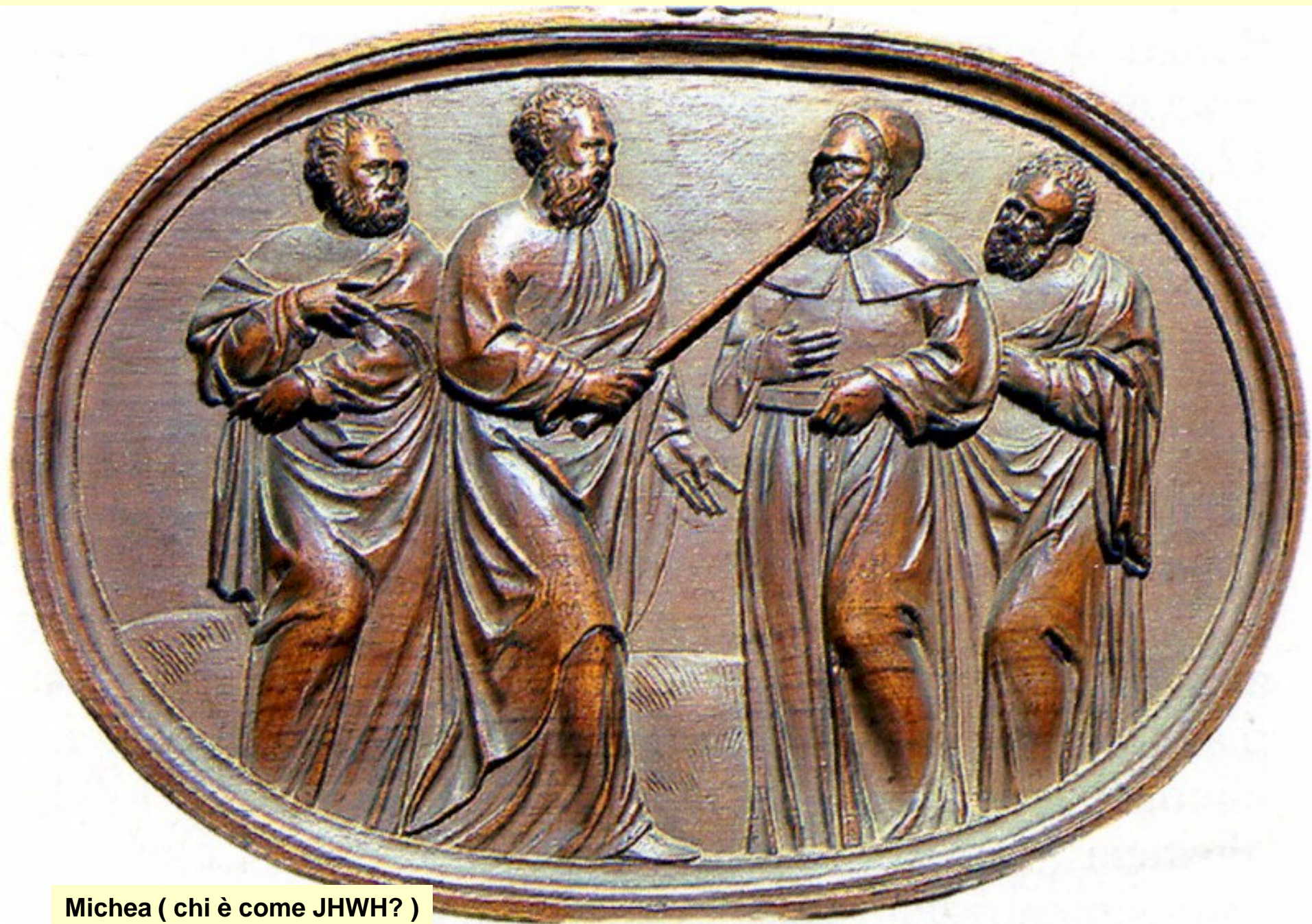
Michea ( chi è come JHWH? )