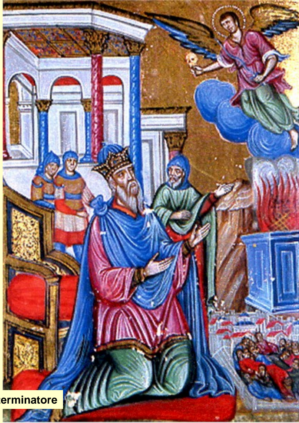
Davide e l'angelo sterminatore