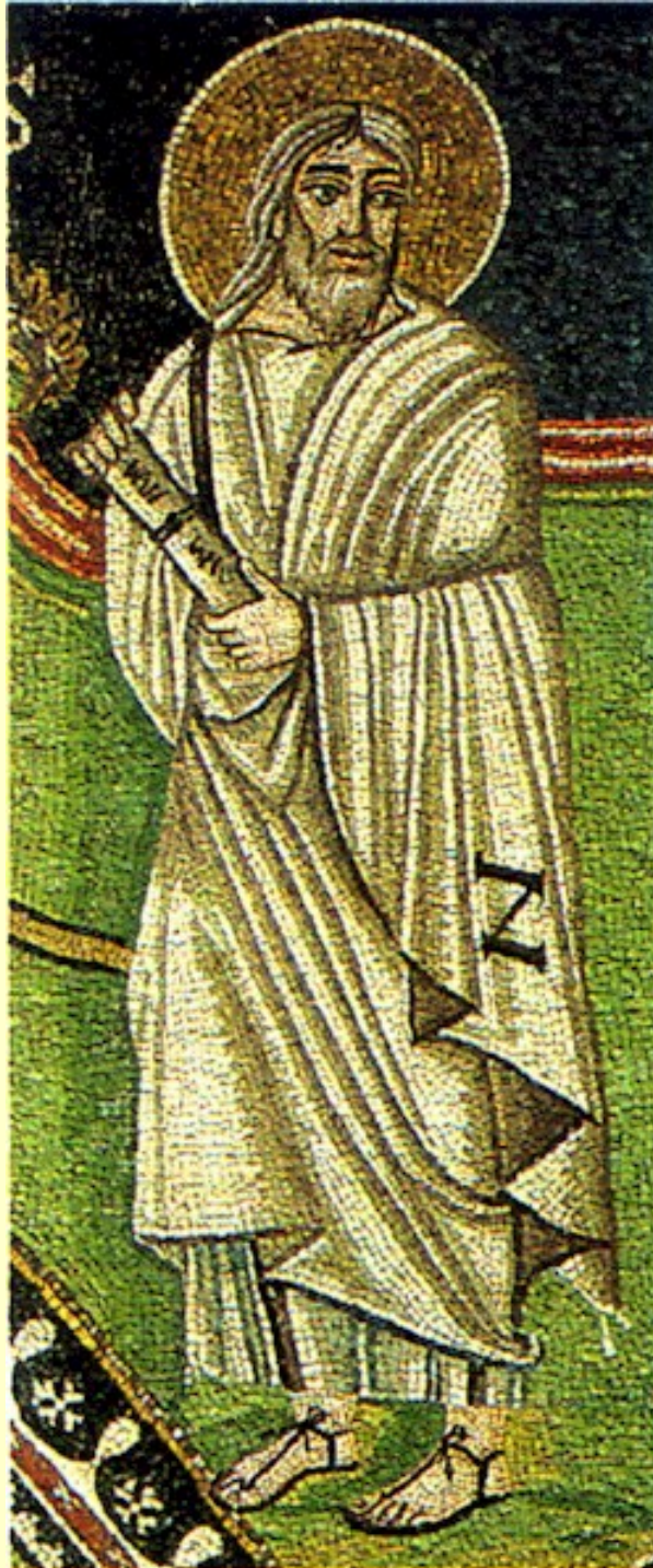
Isaia ( JHWH è aiuto )