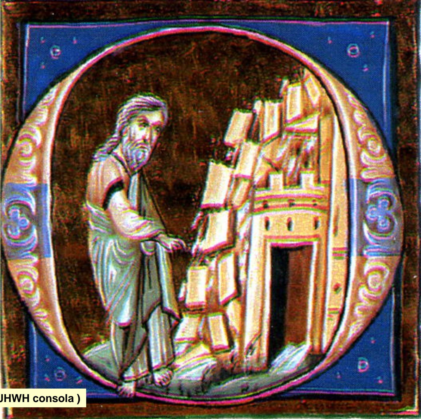
Naum ( JHWH consola )