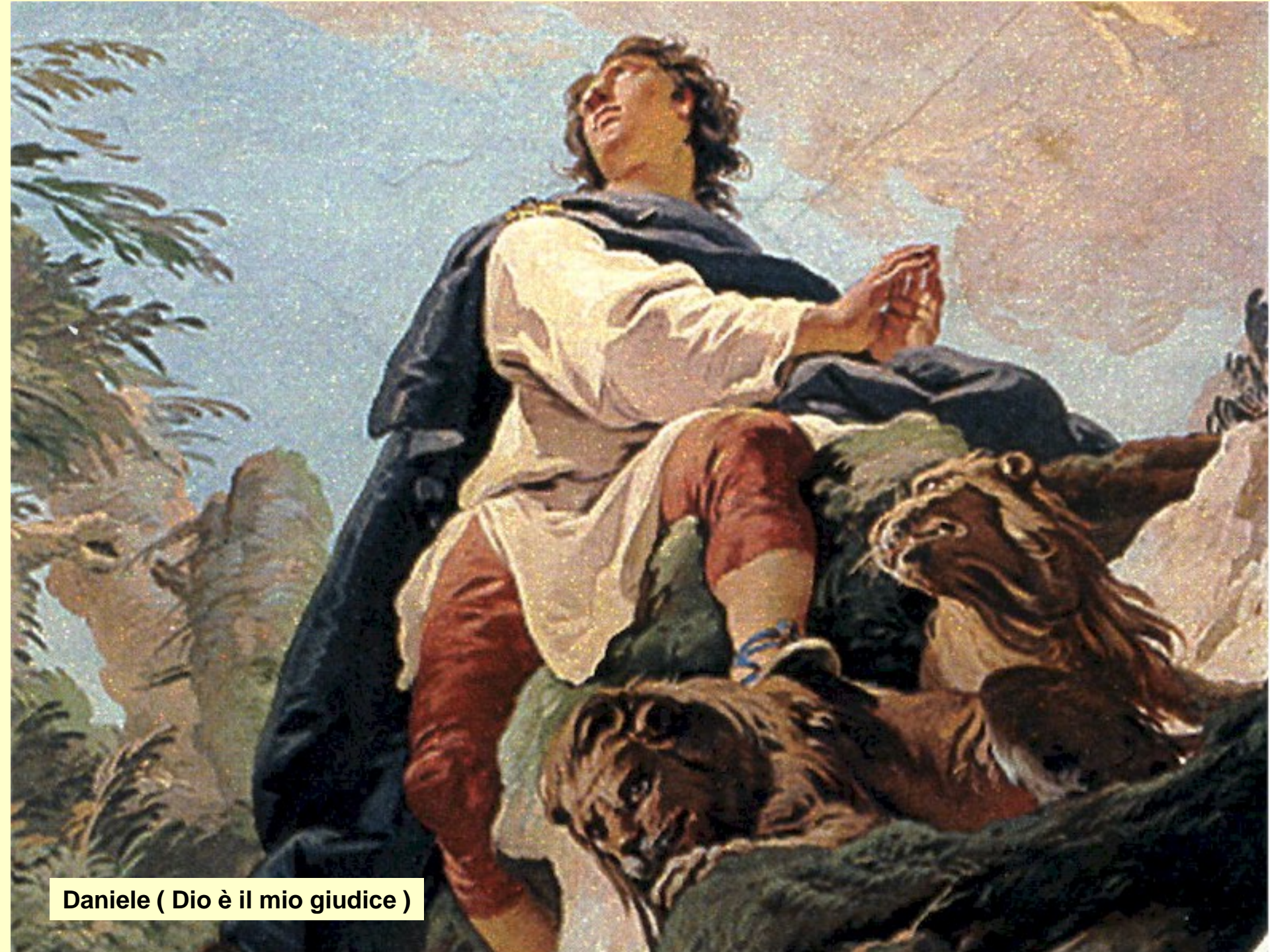
Daniele ( Dio è il mio giudice )