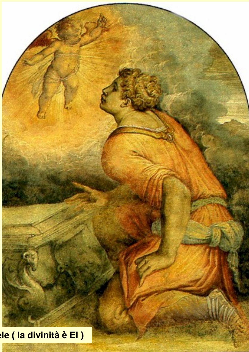
Vocazione di Samuele ( la divinità è El )