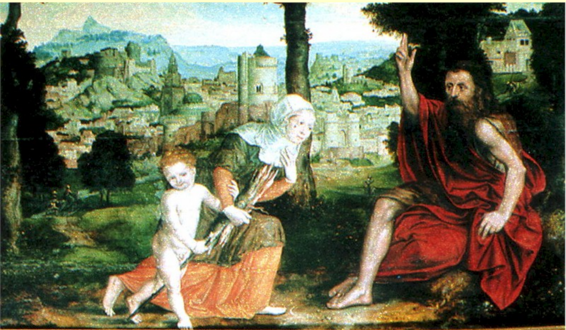
Elia e la vedova di Sarepta ( JHWH è Dio )