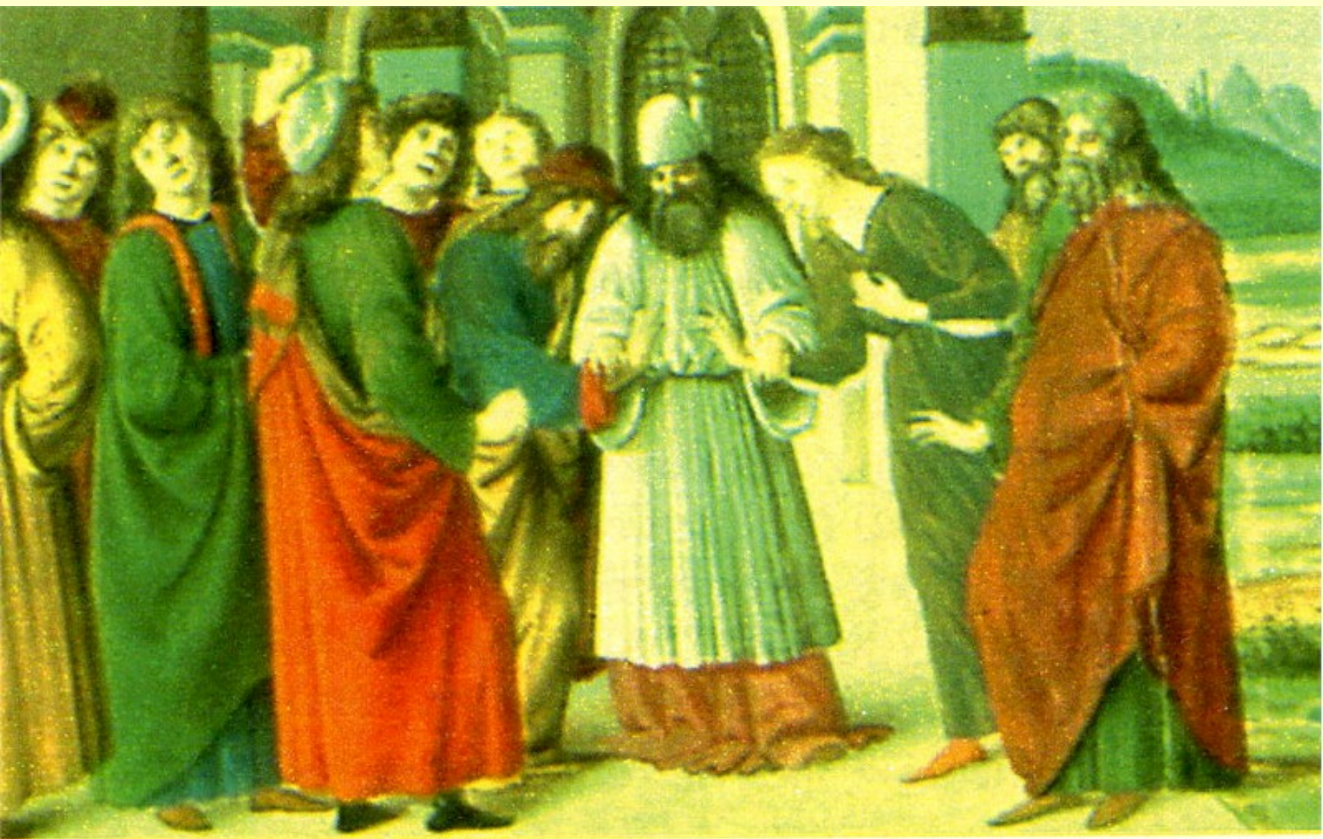
Matrimonio di Osea ( JHWH ha salvato )