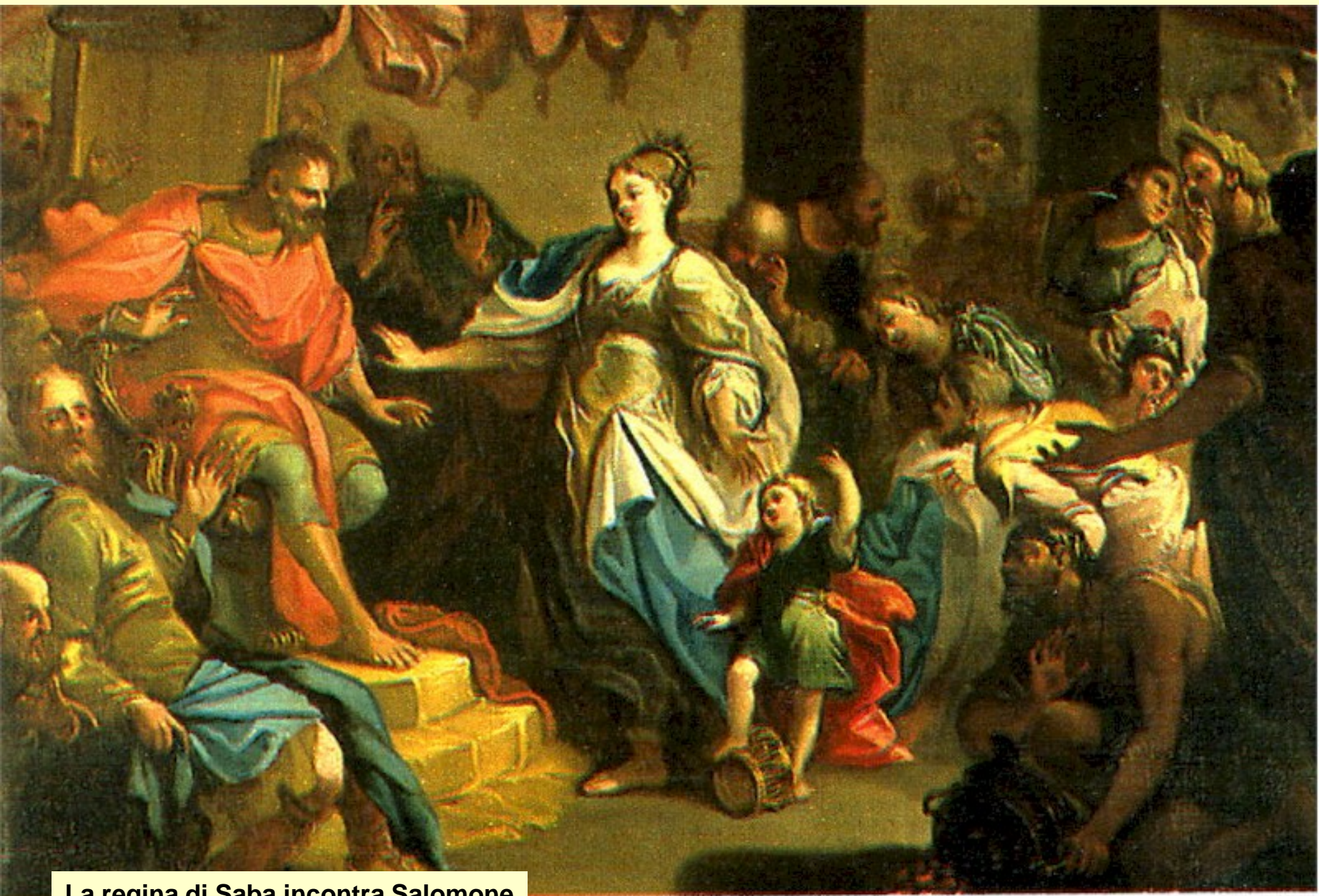
La regina di Saba incontra Salomone