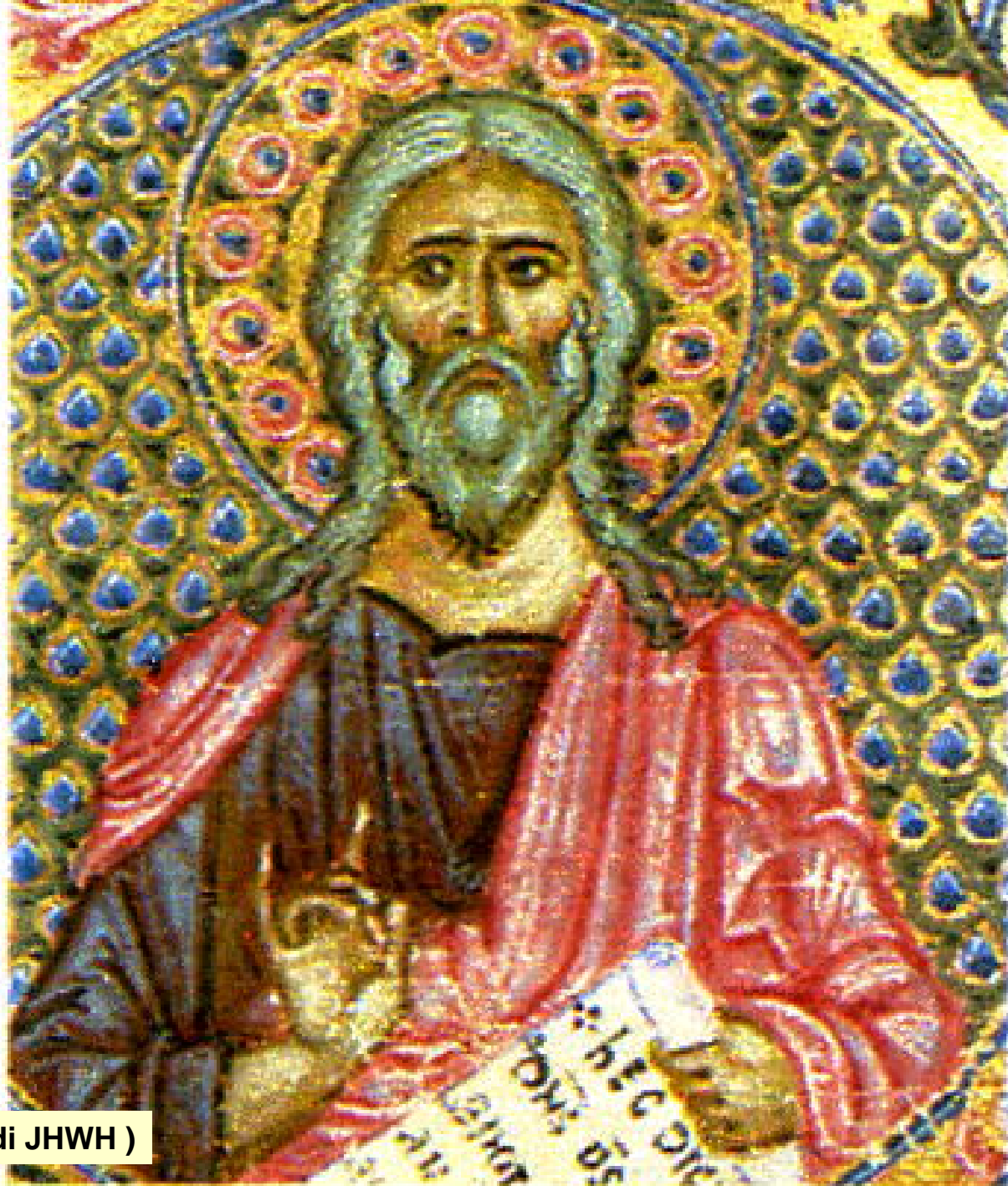
Abdia ( servo di JHWH )