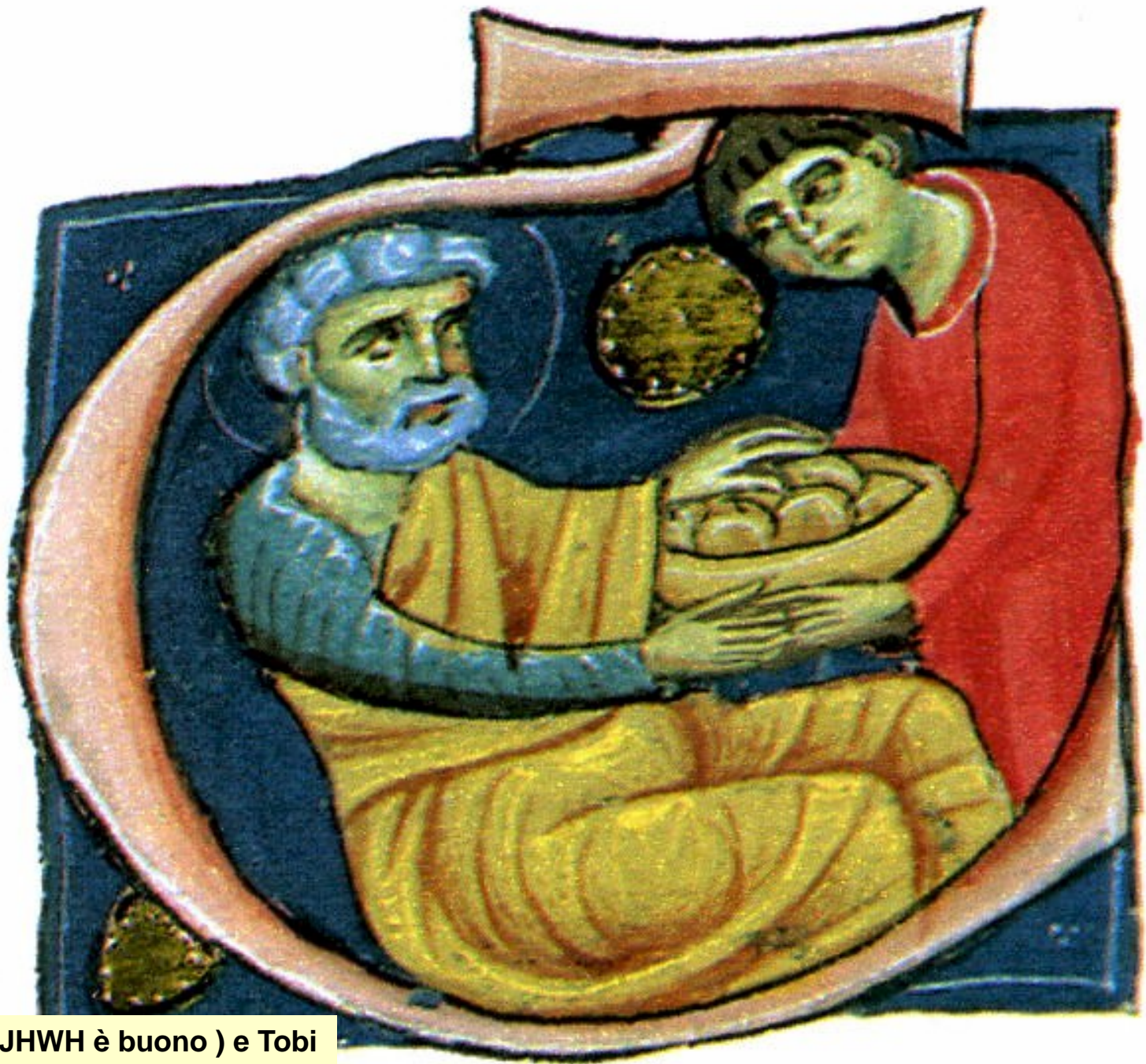
Tobia ( JHWH è buono ) e Tobi