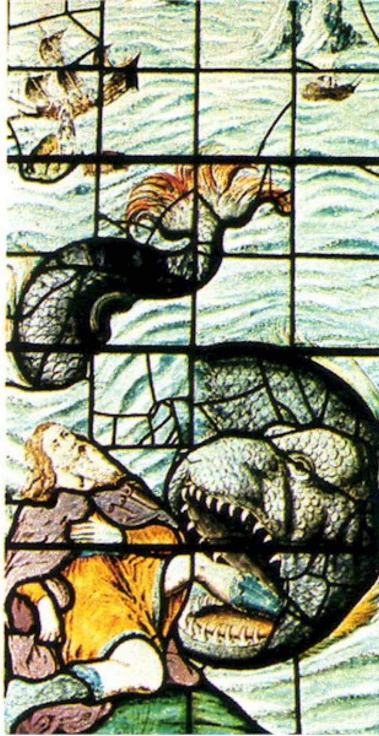
Giona ( colomba )