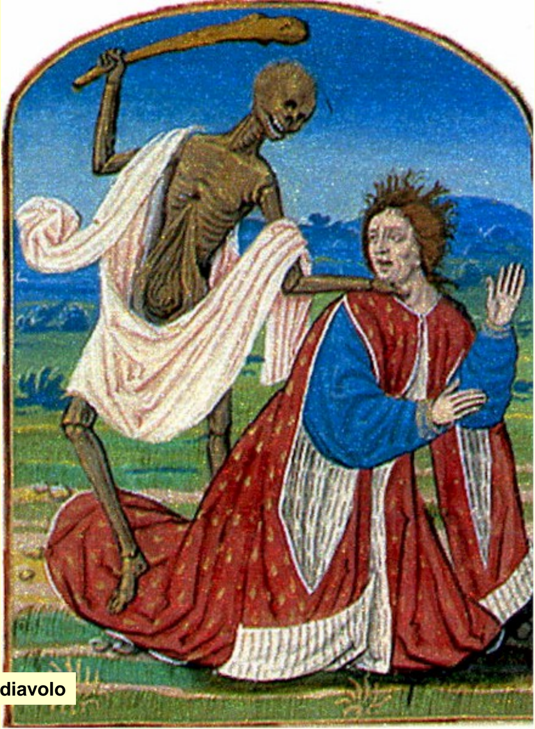
Giobbe tentato dal diavolo