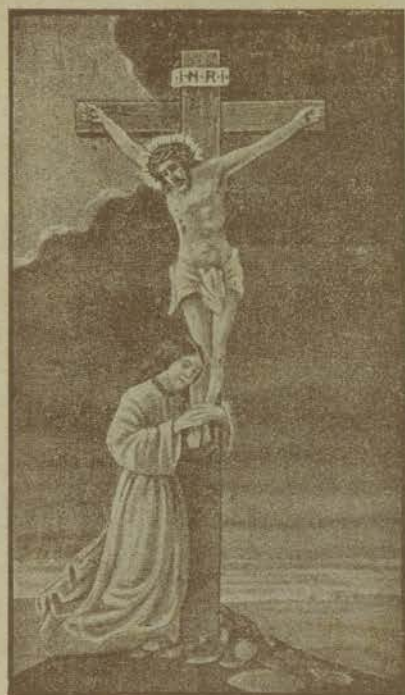
Gesù Crocifisso all'umanità riconciliata.