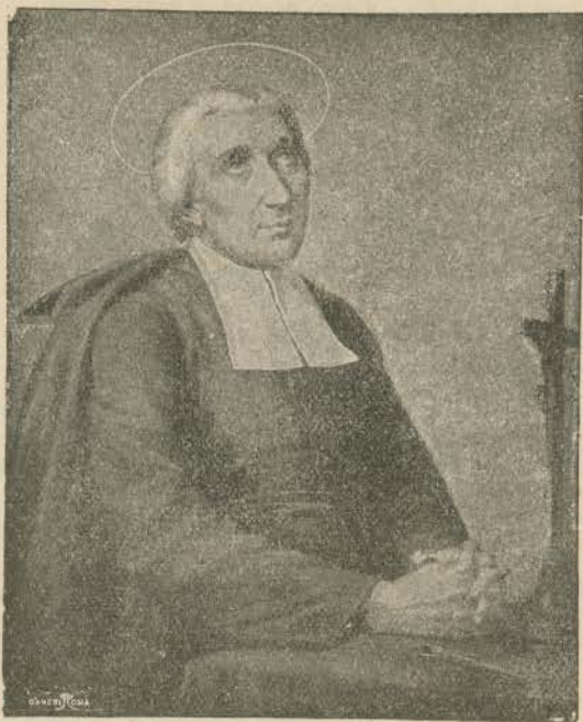
San Giov. Batt. La Salle «Prete Romano»

Le reliquie partirono dal Belgio, e precisamente da Lembecq-lez-Hal, sede dell'antica Casa Generalizia, il giorno 16 Gennaio. Una commovente funzione privata di addio ebbe luogo nella Cappella che custodì le Sacre Spoglie dal 1904 ad oggi, alla presenza di tutti i giovani del Piccolo Noviziato e del Noviziato internazionale. Partite da Bruxelles e scortate da due Fratelli Belgi