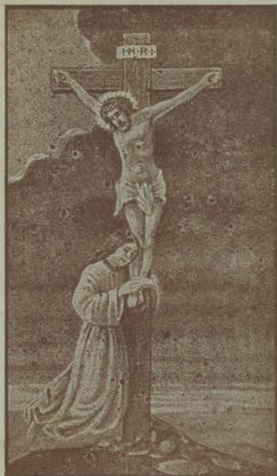
Gesù Crocifisso all'umanità riconciliata.