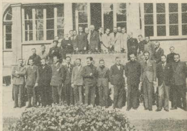
Un gruppo di insegnanti

Ma l'ideale umano non basta: sappiamo tutti che la dignità dell'uomo è stata perfezionata dal cristianesimo, che, con la Grazia di Dio, impreziosisce ogni azione umana. Ed il cristianesimo insegna che il lavoro tutto quanto, intellettuale e manuale, non è soltanto una moneta che si spende per la vita presente, ma è una moneta che serve ad acquistare la vita eterna. Così lo studio, che ha per fine immediato di perfezionare il lavoro, cristianamente serve, con il lavoro, ad uno scopo soprannaturale. Nè l'uomo, il cristiano si dimenticano di avere una Patria terrena, che devono amare, cooperando con lo studio e con il lavoro a renderla sempre più