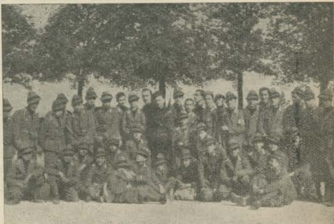
Avanguardisti della « Casa di Carità ».

Nei ferrei ranghi della 1102.a Legione Avanguardia « Mario Sonzini » s'inquadra la bella Centuria della nostra Scuola; forte dei suoi