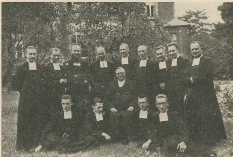
Frères de Pologne.