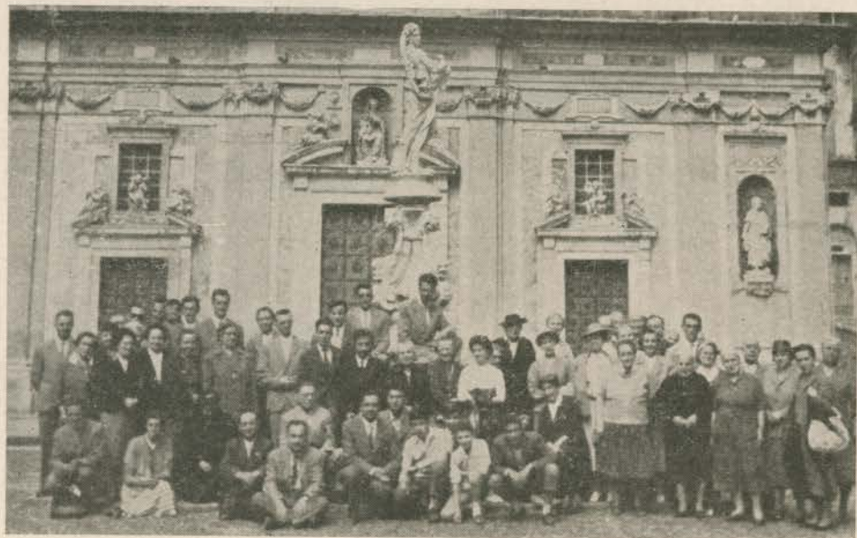
Gruppo dei partecipanti al pellegrinaggio mariano al Santuario di Nostra Signora della Misericordia in Savona.

Al canto del « Magnificat » si rende omaggio alla SS. Vergine nella pia cripta sotterranea. Quale commozione pervade l'animo nostro, mentre riecheggia l'inno dell'amore riconoscente, proprio nel luogo dove la Madonna apparve nel 1536 al contadino Carlo Botta, invitando il popolo savonese alla penitenza e promettendo la sua materna e misericordiosa intercessione presso il Divin Figliolo! Quale profonda somiglianza col messaggio di Lourdes!