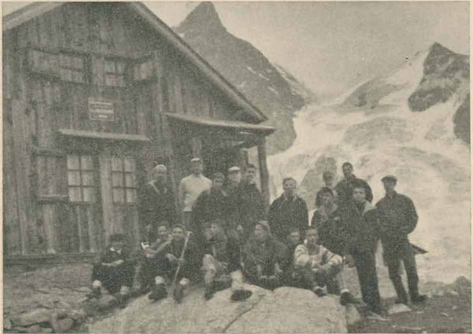
Gita al Castore e al Rifugio Mezzalama