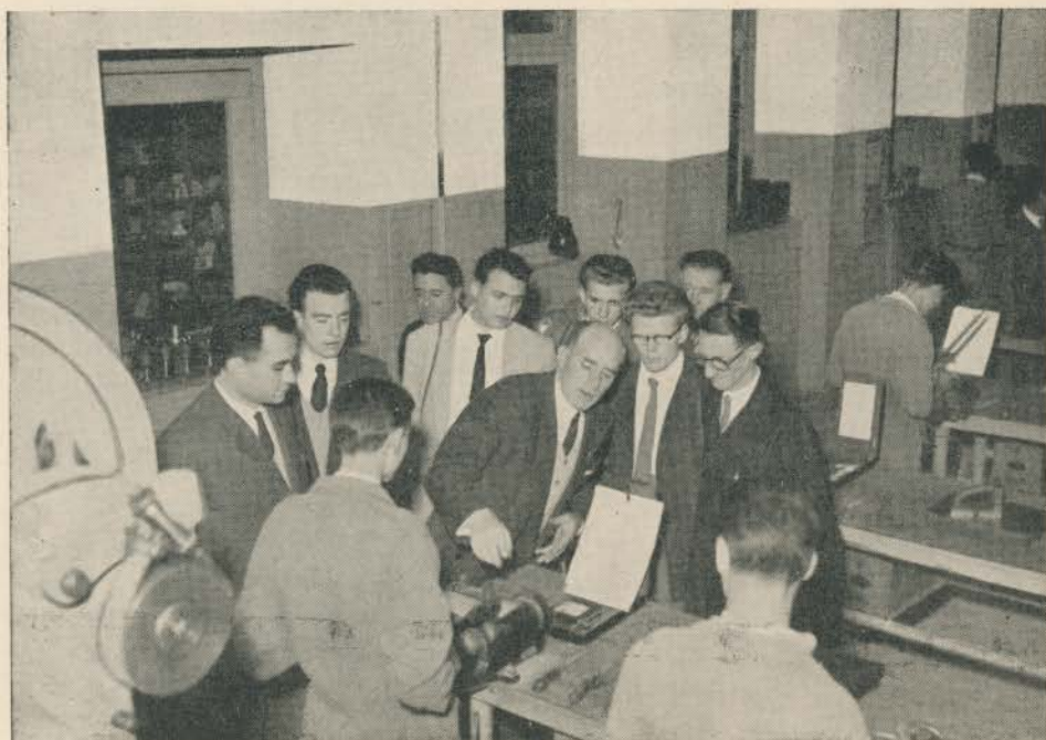
Nel quadro degli scambi culturali italo-inglesi: visita di un gruppo di apprendisti inglesi alla nostra Scuola.