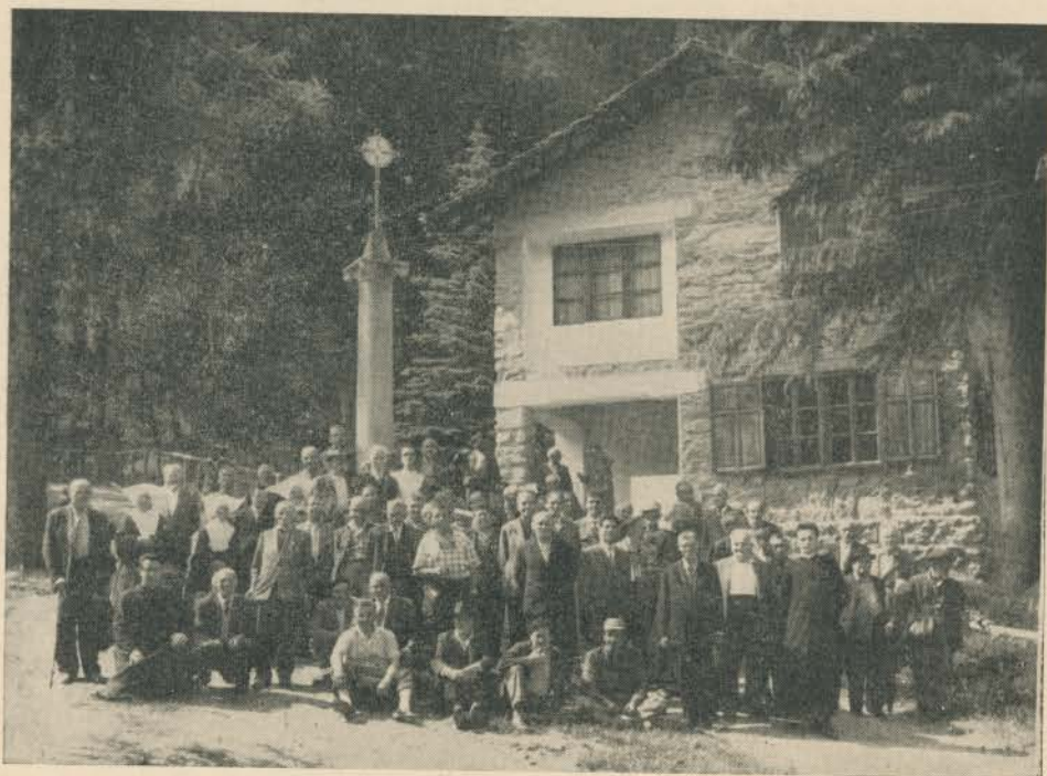
"Messa del Povero,, - Stagione 1958-59 - Gita a Martassina 25-6-1959

Per i nostri poveri fu un giorno di vero sollievo e di letizia, e per i catechisti, le suore e i sacerdoti un giorno di consolazione.