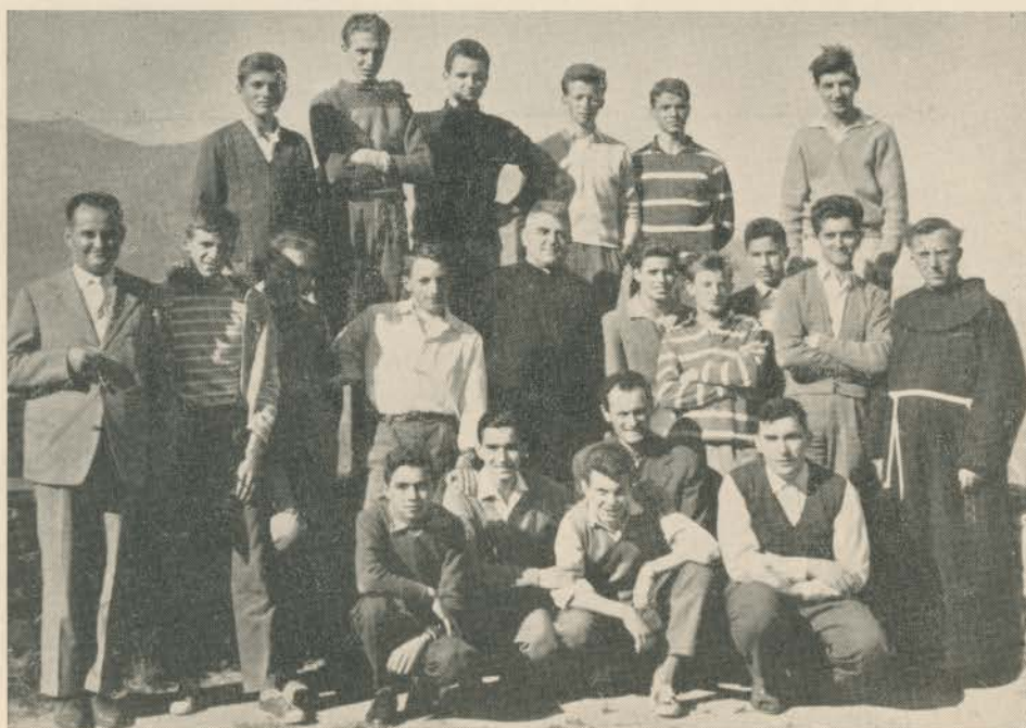
Esercizi Spirituali a S. Ignazio