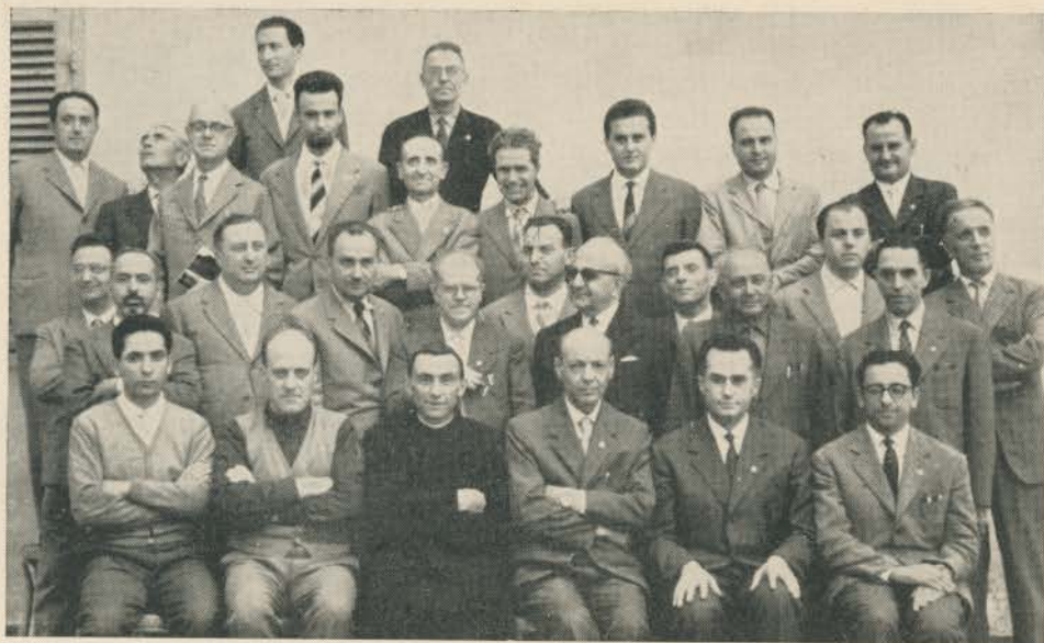
S. Pietro 1959 - Esercizi spirituali annuali - Villa Nicolas (Torino)