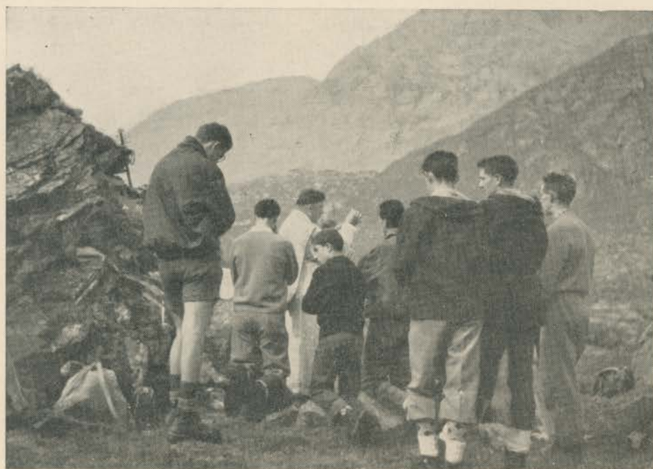
Messa al campeggio