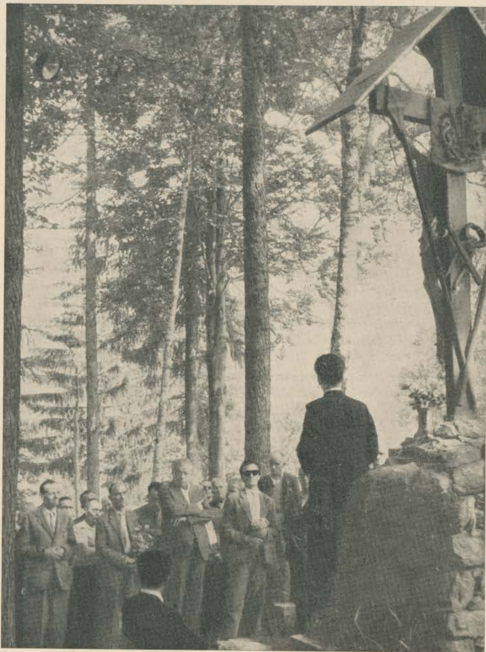
"Messa del Povero,, - Stagione 1958-59 - Gita a Martassina 25-6-1959