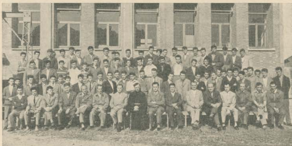
Licenziati dei corsi diurni, a fine giugno 1959

Quasi contemporaneamente hanno ultimato l'anno scolastico anche i CORSI PRE-SERALI e SERALI .