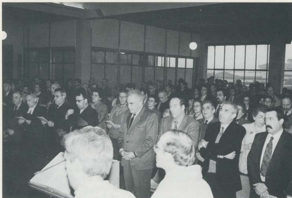
Visuale dei partecipanti alla celebrazione.