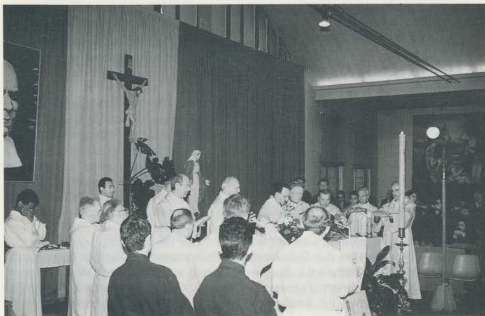
La solenne concelebrazione eucaristica.