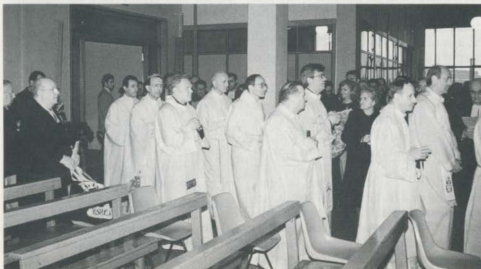
L'ingresso del Vescovo e dei Sacerdoti concelebranti.

Hanno giustificato l'assenza per impegni già presi in precedenza, don Rodol-