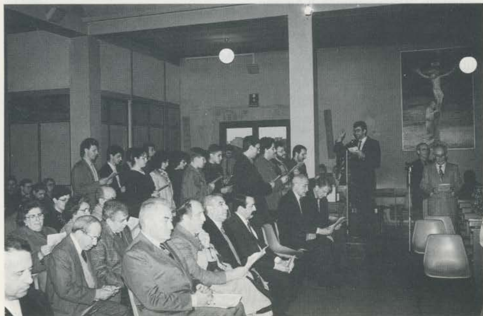
Il coro, composto da allievi della Casa di Carità e da volontari della Messa del povero, conduce i canti durante la celebrazione.

Tra gli intervenuti ricordiamo la sig.ra