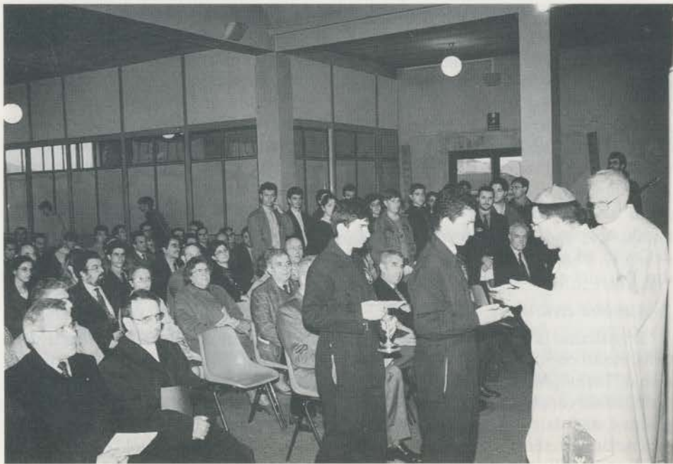
Allievi della Casa di Carità, durante la messa, presentano le offerte.