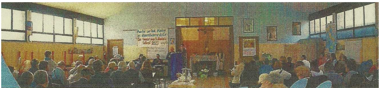
Santa Messa domenicale

È tuttora gestita da Catechisti Congregati, Catechisti Associati e da un fratello delle Scuole Cristiane coadiuvati da volontari, membri della Associazione "Messa del Povero" : (Onlus che conta una trentina di associati, con sede presso il CENTRO ANDREA, Via Guinicelli, 4 - 10132 Torino C.F. 97540030018). In detta sede ogni domenica (eccettuato il mese di agosto) alle ore 8 viene servita una prima colazione a circa 120 persone. Dopo la celebrazione della Messa alle ore 10, a cui talvolta assistono anche dei non cristiani, alle ore 11 da una ventina di giovani volontari è servito il pranzo a circa 180 persone.