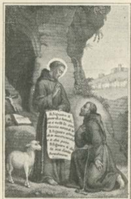
BENEDIZIONE DI S. FRANCESCO

Quando Gesù vorrà venga da te a stamparti un bacio sulla tua bella fronte serena, tutto questo nel Signore valga in corraggiarti ripiega per carere secondo Dio lavorando nella vigna del Signore colla puzza e colla gratienza per amor di Dio, nel silenzio e nella pace ti rovvizo alla vostra cara Mamma e teo.