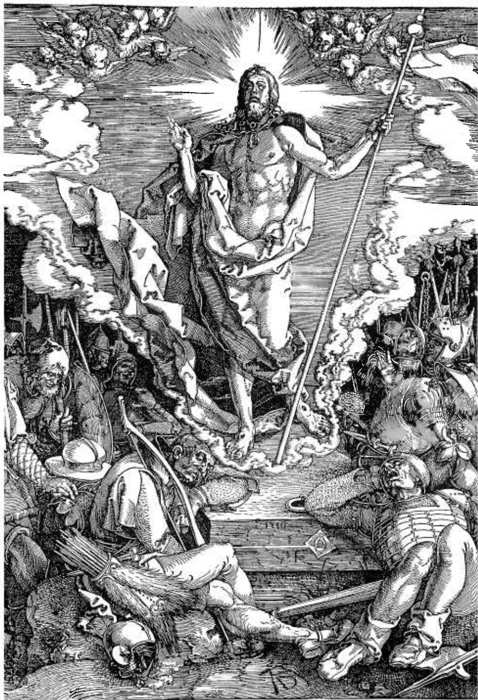
A. Dürer, La Resurrezione . Berlino - Kupferstichkabinett.