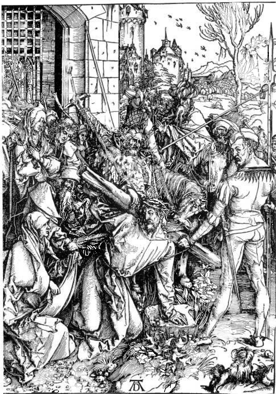
A. Dürer, La Via Crucis . Berlino - Kupferstichkabinett.