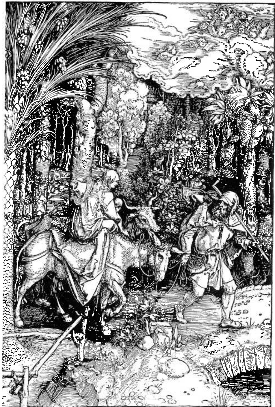
A. Dürer, La fuga in Egitto . Monaco - Staatliche Graphische Sammlung.